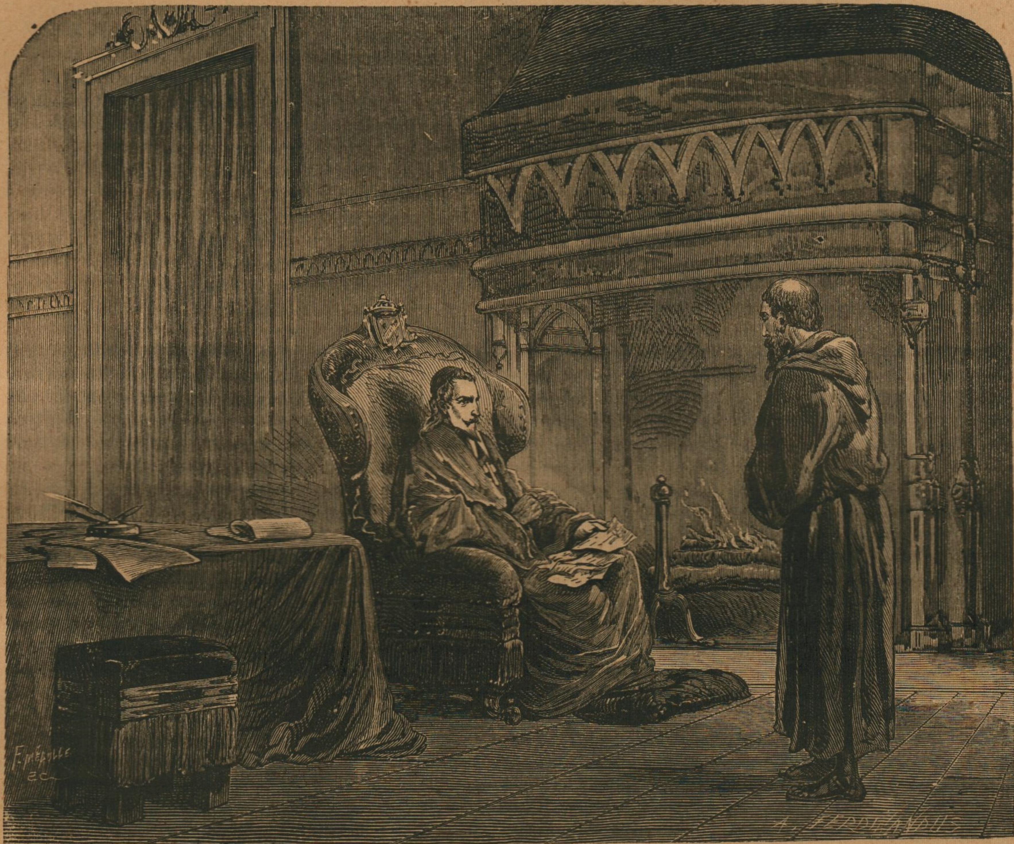
Il vint s'asseoir auprès du Cardinal. — Page 235, col. 3.

SOMMAIRE. CINQ-MARS, par ALFRED DE VIGNY. LES DRAMES DE LONDRES (3 e partie), par B. DEROSNE. LES SECRETS D'UNE SORCIÈRE, par LA COMTESSE DASH.